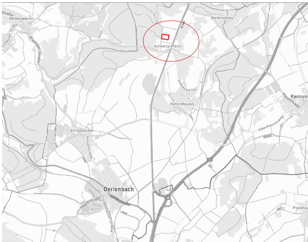
Abb. Lage des Vorhabens (ohne Maßstab)

Im o. g. Geltungsbereich soll ein Sondergebiet ausgewiesen werden. Die Lage und Abgrenzung ist aus dem nachfolgenden Kartenausschnitt ersichtlich (maßstabslos).