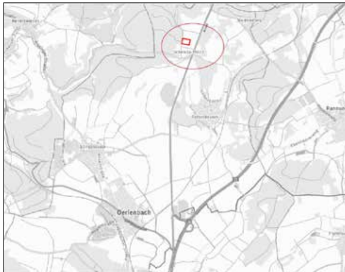
Abb. Lage des Vorhabens (ohne Maßstab)

Die Bekanntmachung der Öffentlichen Auslegung gemäß § 3 Abs. 2 BauGB sowie der Behörden und sonstigen Träger öffentlicher Belange gem. § 4 Abs. 2 BauGB wird im Amtsblatt des Landratsamtes Bad Kissingen am 12.07.2024, Nr. 14, veröffentlicht.